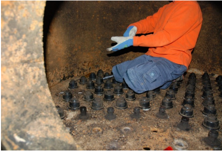
Ausbau alte Filterdüsen

Wollten Sie schon immer wissen, wie ein Kiesfilter von innen aus sieht und Ihr Wasserwerk besichtigen? Sprechen Sie uns an, die Gelegenheit ist günstig. Typischerweise werden Filter mehrere Jahrzehnte betrieben, ohne dass sie geöffnet werden.