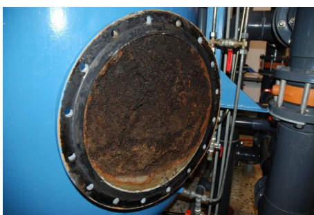
Geöffneter Filter mit Filterkies

Mit Unterstützung von externen Beratern haben wir uns entschlossen, einen Filter zu öffnen, inspizieren und instand zu setzen. Hintergrund ist die nicht erklärbare geringe Filterleistung.